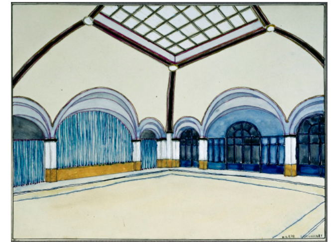
Salle des fêtes de la Maison des Centraliens, de Maurice-Paul du Bois d'Auberville dessinateur, n. d. (20 e siècle). 19.4 x 25.4 cm.

Par l'organisation d'événements diversifiés tout au long de l'année (rencontres annuelles, visites et rendez-vous) et la publication de sa revue Profils , l'AHA porte les intérêts de cette communauté élargie, favorise la diffusion des connaissances et contribue ainsi à la visibilité de l'histoire de l'architecture.