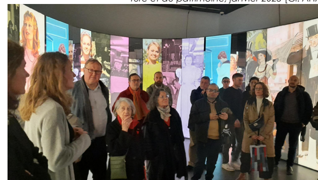
Visite de l'exposition La saga des Grands Magains, Cité de l'architecture et du patrimoine, janvier 2025

Tout au long de l'année, l'AHA organise des visites d'exposition ou d'édifices, des conférences ou des présentations d'ouvrages. Événements gratuits (en dehors de droits d'accès éventuels), les rendez-vous offrent aux membres des possibilités régulières de se retrouver et d'échanger avec les membres d'autres associations, au gré des liens et partenariats tissés avec celles-ci (Ghamu, l'Association francophone d'histoire de la construction, DoCoMoMo-France, etc.).