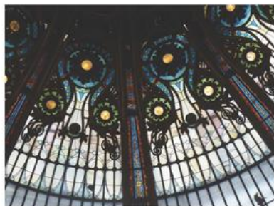
Détail de la coupole de Gabriel Lully (1645-1646)