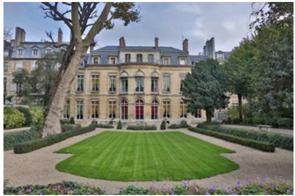
Germain Boffrand, Hôtel Amelot de Gournay, vues de la façade sur cour et jardin (© Mélanie Challe/Maison de l'Amérique latine), actuelles Ambassade du Paraguay et Maison de l'Amérique latine au 1, rue Saint-Dominique